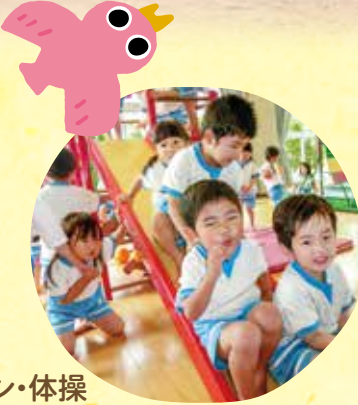
主な活動(カリキュラムに沿った教育)